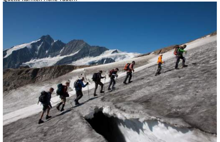
Anstieg zum Mittleren Bärenkopf