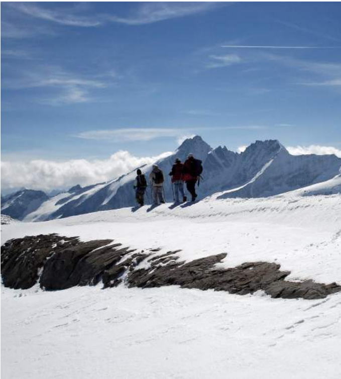
Am Mittleren Bärenkopf