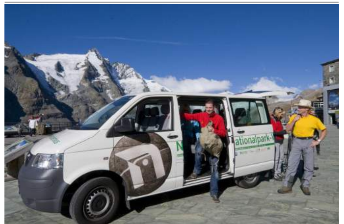
Nationalpark Wanderbus Haltestelle Kaiser-Franz-Josefshöhe