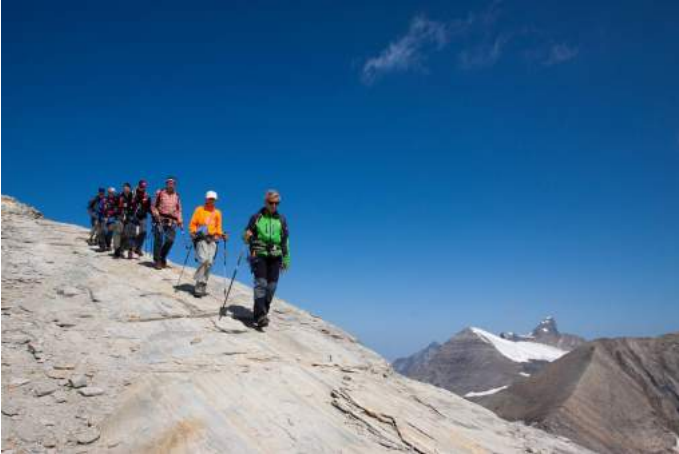
Abstieg vom Mittleren Bärenkopf Autor Manfred Rupitsch / Birgit Christ Quelle Kärnten Hohe Tauern