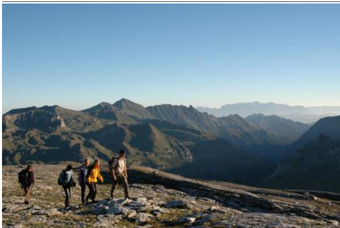
Am Geotrail Tauernfenster Autor G. Mussnig Quelle Karnten Hohe Tauern