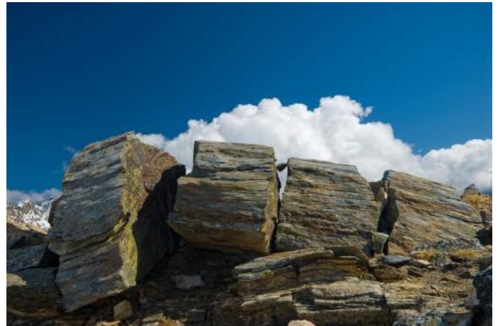
Gesteinsformation am Geotrail Autor K. Dapra Quelle Karnten Hohe Tauern