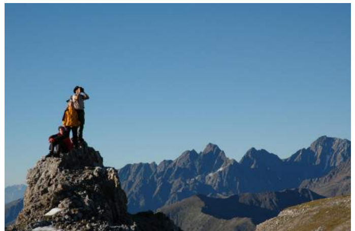
Mit Nationalpark-Ranger am Geotrail Autor G. Mussnig Quelle Karnten Hohe Tauern